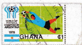
Exemples de timbres surchargés.

Un des rares catalogues qui traite de ces surcharges parle de surcharge aléatoire (« haphazardly »). Chaque timbre ainsi « maculé » peut présenter une seule frappe, d'autres plusieurs. Il est impossible qu'une machine ait pu faire cela.