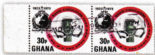
Paire de timbres-poste surchargés ne figurant pas dans le catalogue anglais.

Nous avons la preuve que cette liste n'est pas complète, le timbre-poste ci-après, surchargé comme on peut le constater de visu , n'y figurant pas.