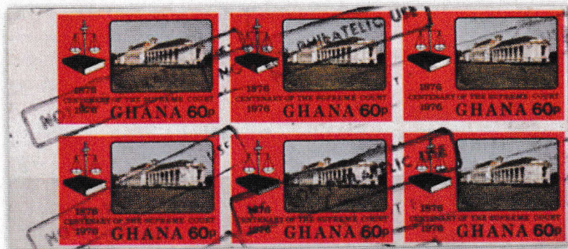
Bloc de 6 timbres-poste non dentelés surchargés.

Il n'y a pratiquement pas de documentation disponible, pas de club philatélique local pouvant nous renseigner. L'association la plus à même d'aider ( Le West Africa Study Circle – le Cercle d'études de l'Afrique de l'Ouest), contactée, n'a pu fournir que très peu d'informations.