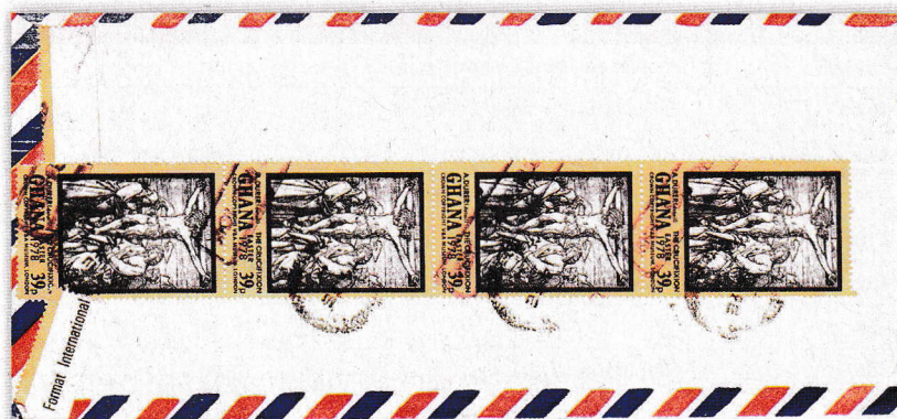
Exemple de pli présentant des timbres-poste surchargés oblitérés.

STANLEY-GIBBONS. Le traitement est toutefois sommaire pour le premier, celui-ci se contentant de signaler qu'une opération de surcharge avait eu lieu en 1983 (« En 1983, diverses feuilles de timbres spéciaux ont été surchargées d'un tampon manuel principalement bleu portant la mention « NOT FOR PHILATELIC USE » 2 ).