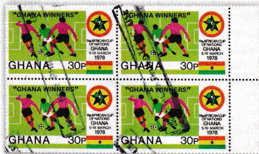
Bloc de quatre timbres-poste neufs gommés surchargés.

A priori (voir ci-après le paragraphe consacré aux questions restant non élucidées), ces frappes étaient réalisées par les guichetiers eux-même, se faisaient dans les bureaux de poste et ne servaient qu'à l'affranchissement des plis. Les timbres-poste n'étaient pas vendus aux collectionneurs 1 . En théorie, donc, il est impossible de trouver de tels objets neufs (ie. avec une gomme intacte)... sauf que, comme souvent en pareil cas, des collectionneurs un peu plus débrouillards que les autres ont pu s'en procurer certains :