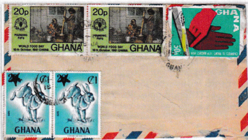
Pli affranchi avec, parmi d'autres, un timbre-poste non dentelé surchargé.